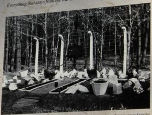
Fotografia przedmiejscu pamięci odłamki w 1965 r.

The number of forced laborers murdered in Kraśnik amounts to approx. 2000. Heinkel ex until today. Currently the halls of the former Ammunition Factory house Polish Bearings Factory. Everything that stays from the war time is a memory of what has been lost