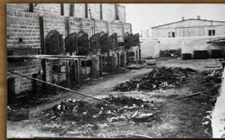
Szczątki zwęglonych zwłok i piec krematoryjny. Majdanek, 1944 r.