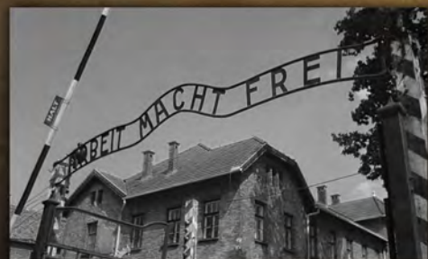
Napis nad bramą do obozu Auschwitz „Arbeit macht frei” (niem. praca czyni wolnym).

środek chemiczny z grupy pestycydów (substancja do zwalczania szkodników), wykorzystywany przez III Rzeszę Niemiecką jako środek do uśmiercania ludzi w komorach gazowych obozów zagłady. Ofiary uśmiercane Cyklonem B umierały w straszliwych męczarniach.