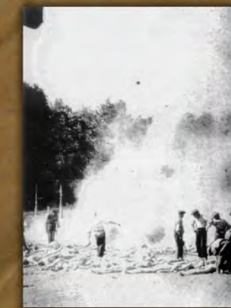
Sonderkommando w czasie palenia ciał zamordowanych Żydów. Auschwitz-Birkenau, 1944 r.

Wpychaniem do komór i gazowaniem zajmowało się dwóch strażników ukraińskich, którzy pomagali sobie w tych czynnościach metalową rurą i szablą. Gazowanie stłoczonych ludzi trwało około 20 minut. Czasami proces ten przedłużano. Zwłoki wraz z krwią i ekskrementami wyciągane były po pochylej podłodze komory przez otwarte z zewnątrz włazy. Po wyrwaniu ze zwłok złotych zębów oraz wyjęciu ukrytych w otworach ciała przedmiotów wartościowych, zwłoki trafiały do dołów. W późniejszym okresie transportowano je bezpośrednio na ruszty za pomocą skórzanych rzemieni, pasów lub na drewnianych noszach. [...]