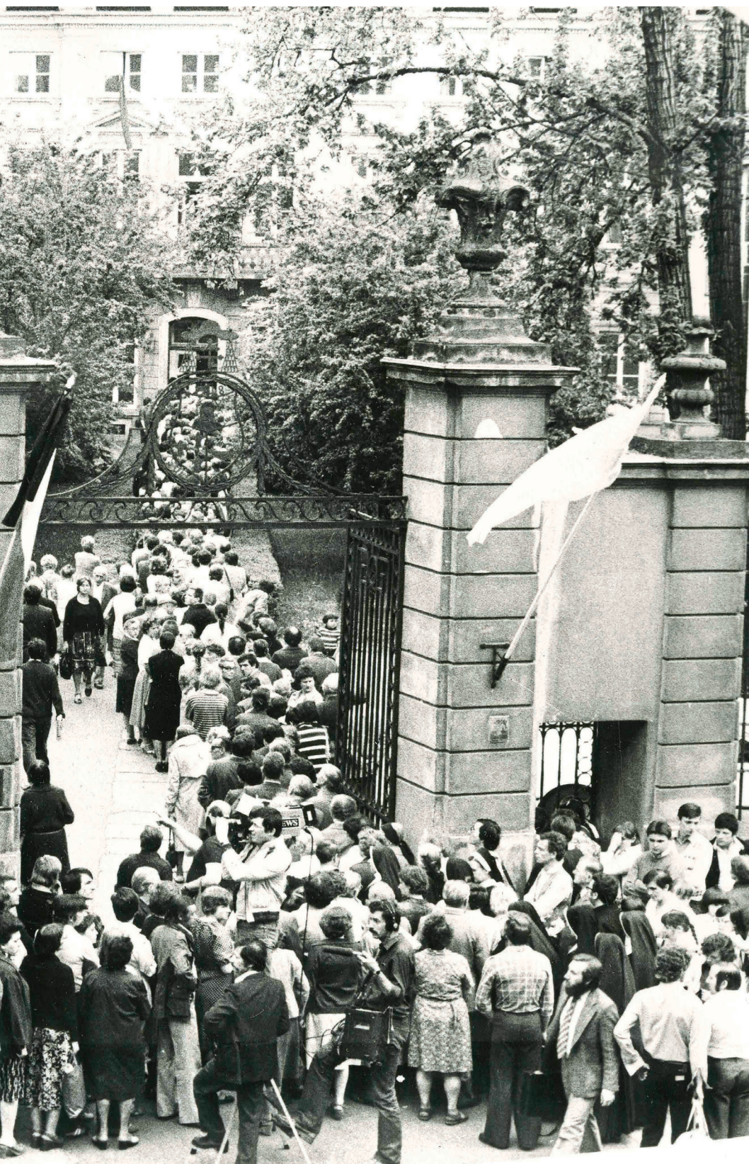
Tłumy czekają w kolejkę, by oddać hołd zmarłemu Prymasowi Wyszyńskiemu, 28–29 maja 1981 r.