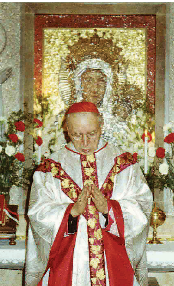
Prymas Stefan Wyszyński odprawia Mszę św. w kaplicy polskiej w Grotach Watykańskich.

Jego Eminencja Ksiądz Stefan Kardynał Wyszyński, Prymas Polski. Przyczyną zgonu był rozsiany proces nowotworowy jamy brzusznej o wybitnej złośliwości i szybkim postępie”.