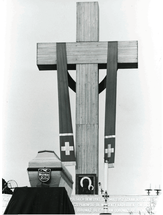
Msza św. pogrzebowa na pl. Zwycięstwa, 31 maja 1981 r.

Teraz niemal w tym samym miejscu stał krzyż, u którego podnóża umieszczono obraz nawiedzenia Matki Bożej Częstochowskiej. Liturgii żałobnej przewodniczył