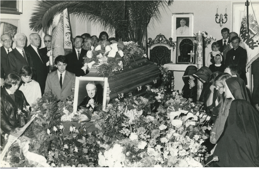
Czowanie modlitewne przy trumnie Prymasa Stefana Wyszyńskiego w Domu Arcybiskupów Warszawskich; w głębi po prawej ks. Jerzy Popiełuszko, 28–29 maja 1981 r.

Od wieczora 28 maja do popołudnia 31 maja przez kościół seminaryjny przewinęło się około pół miliona osób, które oddały hołd zmarłemu Prymasowi. Kolejka kończyła się przed kościołem Sióstr Wizytek, mniej więcej w tym miejscu, gdzie stoi teraz pomnik kard. Wyszyńskiego. Wdzięczność Prymasowi Tysiąclecia chciała okazać cała Polska. Przed jego trumną czuwały warty honorowe: duchownych, związkowców, studentów i młodzieży szkół średnich, stronnictw politycznych, większych zakładów pracy.