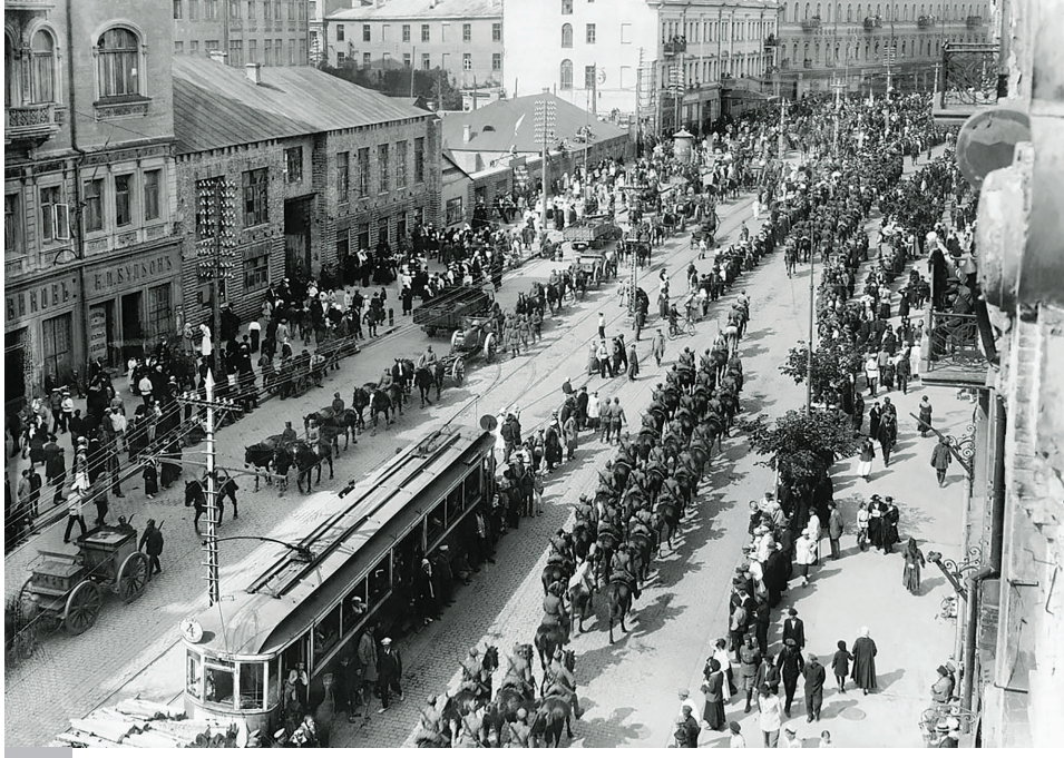
Wojsko Polskie wkracza do Kijowa, 7 maja 1920 r.

zapewniały osobom narodowości polskiej znajdującym się w Rosji, na Ukrainie i na Białorusi swobodny rozwój kultury i języka oraz wolność praktyk religijnych. Te same prawa zapewniono przedstawicielom narodowości rosyjskiej, ukraińskiej i białoruskiej w Polsce.