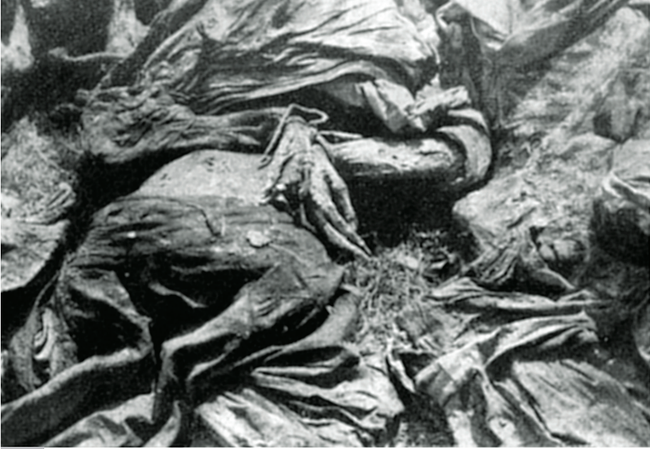
Jedna z ofiar bolszewickiego terroru wydobytych podczas niemieckiej ekshumacji w Winnicy w 1943 r. z rękami związanymi w charakterystyczny dla NKWD sposób.

przydrożne spalili, a święta doroczne skasowali. [...] Setki tysięcy braci naszych rozproszono po obcych i dzikich krajach, skazując ich na zagładę. Któż zważy, braciszku, ich krzywdy?! Kto zmierzy ich boleść?!”