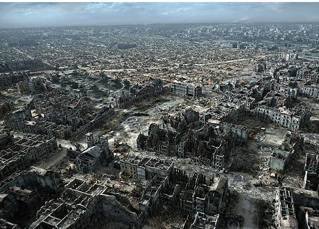
Warszawa w 1945 r. (rekonstrukcja). Kadr z filmu Miasto ruin produkcji Muzeum Powstania Warszawskiego

darzyło się w Warszawie, gdzie ludzkiej hekatombie towarzyszyło zrównanie z ziemią lewobrzeżnej części miasta, wyburzanego już po stłumieniu powstania. A przecież trzeba pamiętać, że poważnie zniszczone zostały także Białystok, infrastruktura przemysłowa Górnego Śląska, Poznań, a na terenach poniemieckich, przyznanych Polsce, w gruzach leżał Wrocław, zamieniony w Festung Breslau, nie mówiąc już o przypadkach takich, jak Głogów, gdzie doszczętnie zniszczone zostało 90 proc. miasta. Tym razem nieporównywalnie do wcześniejszego okresu zrujnowane zostały przyfrontowe tereny wiejskie – w wielu przypadkach zaminowane lub zrównane z ziemią. Te straty wciąż nie zostały w pełni oszacowane. W odniesieniu do materialnej substancji majątkowej