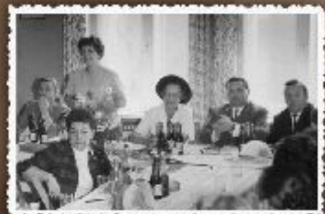
Wieloletnia praca w Dobrej Fabryce, 1968