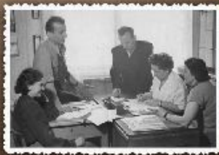
Wieloletnia praca w Dobrej Fabryce, 1968

W roku 1946 rozpoczęła pracę w Dobrej Fabryce, gdzie w 1965 roku została kandydatką na członkinię W. Ruchu, którą wybrano na sekretarza zakładowego komitetu. W 1968 roku została wybrana na członkinię Komitetu Miejskiego w Górze. W 1970 roku została wybrana na członkinię Komitetu Miejskiego w Górze. W 1975 roku została wybrana na członkinię Komitetu Miejskiego w Górze. W 1980 roku została wybrana na członkinię Komitetu Miejskiego w Górze. W 1985 roku została wybrana na członkinię Komitetu Miejskiego w Górze. W 1990 roku została wybrana na członkinię Komitetu Miejskiego w Górze. W 1995 roku została wybrana na członkinię Komitetu Miejskiego w Górze. W 1996 roku została wybrana na członkinię Komitetu Miejskiego w Górze.