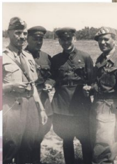
1942 r. - ZSRR