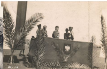
1942 r. - Irak