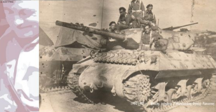
1940/1945 r. - Włochy, żołnierze z Właszczańską Dywizją Pancerną

Kolejnymi ważnymi punktami na szlaku zwycięstw II Korpusu było zdobycie miasteczka Piedimonte, a następnie Ankonę i Pesaro. Później żołnierze gen. Andersa kontynuowali walki w trudnych terenach Apenin Emiliańskich. Szlak bojowy II Korpusu zakończył się 21 kwietnia 1945 r. zdobyciem Bolonii.