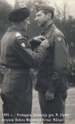
1945 r. - Predappia, dekadacja gen. M. Clarka Krzyżem Orderu Wojennego Virtuti Militari