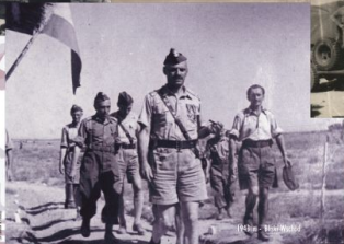
1946 r. - Blizki Wschód