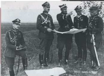
1925 r. - mapy w Woźnie