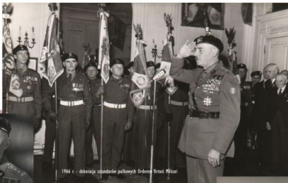
1966 r. - odebranie sztandarów pahlowych Orderem Virtuti Militari

Order Św. Jerzego Order św. Władysława z Pięcioma Order św. Anny z Pięcioma (IX, X, XI, II klasa) Order św. Szymona z Pięcioma (II i III klasa)