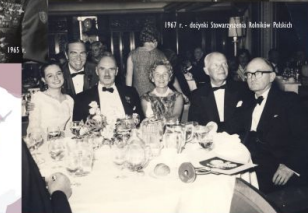
1967 r. - decyzji Stowarzyszenia Polaków Polskich