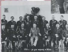
1934 r. - po grze wojennej w Winiu