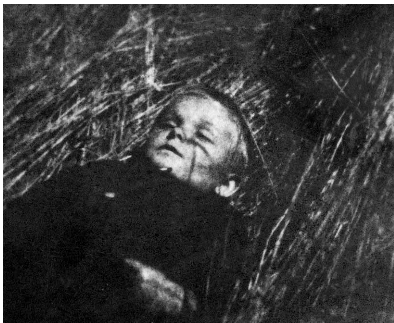
Zwłoki dziecka zamordowanego podczas akcji pacyfikacyjnej w okolicach Szczepieszyna

w Lublinie przy ul. Krochmalnej oraz w Budzynie (powiat Kraśnik); matki wraz z dziećmi najczęściej w obozie koncentracyjnym na Majdanku. Jak podają źródła, w krótkim czasie znaczna część z nich zmarła, a część zginęła w komorach gazowych.