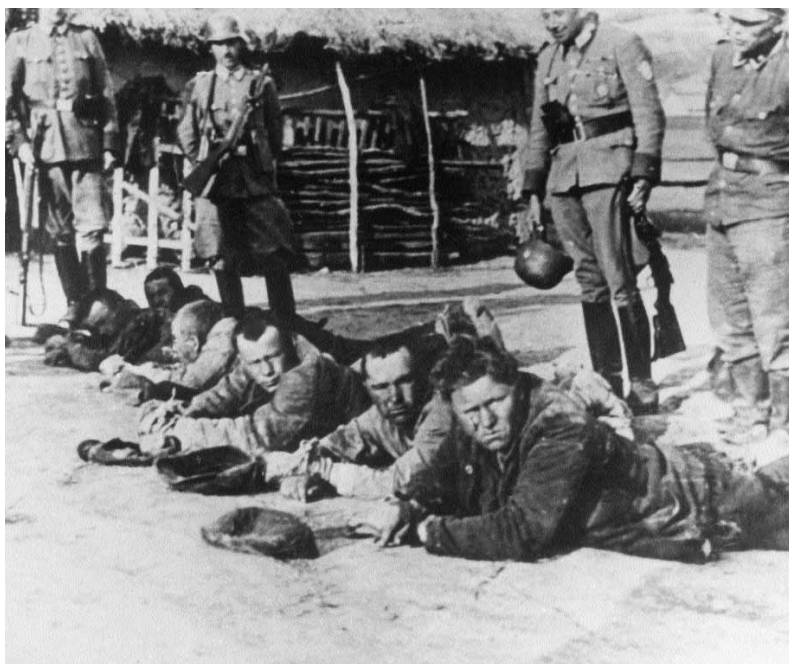
Pacyfikacja wsi Bartłogi, były powiat Puławy

następowała automatycznie. Nie przeprowadzono badań rasowych, ponieważ ludność Śląska uważana była za etnicznie niemiecką. W przytułkach, do których trafiały dzieci, angażowano niemiecki personel lub zakwaterowywano niemieckie dzieci, co miało przyspieszyć proces wynarodowienia. Dzieci, które trafiały do niemieckich rodzin, izolowano od środowiska polskiego. W Kraju Warty i na Pomorzu typowano dzieci nadające się do zniemczenia drogą selekcji rasowej. Te, które miały cechy nordyckie, wysyłano w głąb Rzeszy. Szczególnie interesowano się tymi, które znajdowały się w zakładach opiekuńczych, ponieważ pozbawione były związków rodzinnych.