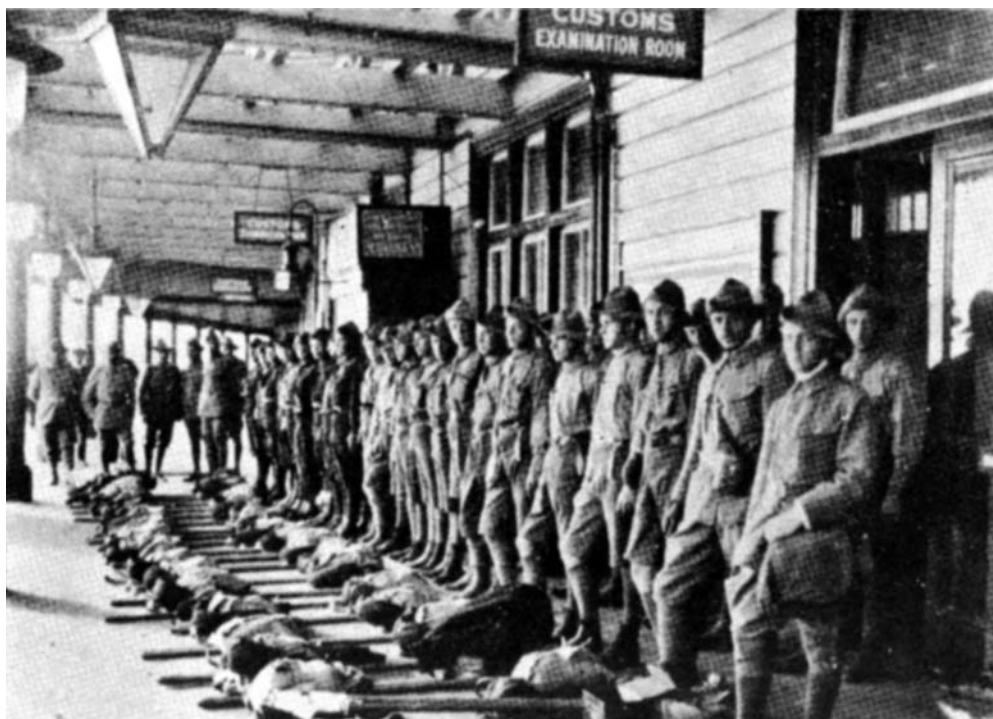
Drużyna polska na dworcu w Folkestone