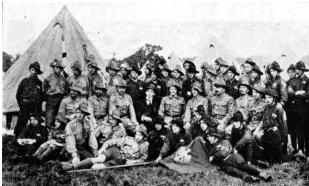
Drużyna polska w obozie pod Birmingham.

Andrzej Małkowski, zainspirowany ideami skautowymi, planował zaadaptowanie do polskich warunków propozycji Baden-Powella. Przede wszystkim bardzo mocno zakorzenił polski skauting w patriotyzmie i dążeniu do niepodległości.