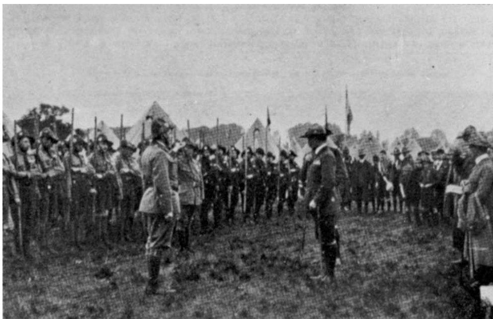
Polska drużyna składa meldunek Robertowi Baden-Powellowi