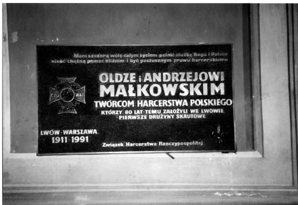
Tablica w rzymskokatolickiej katedrze lwowskiej

skazuje go na 24-godzinny areszt domowy, o którego terminie zadecyduje komendant szkoły żołnierskiej. Jako rehabilitację Sąd nakazuje żołnierzowi nr 14 przetłumaczenie dzieła pod tytułem: Scouting for boys do 15 kwietnia br. i nadesłanie tegoż na ręce dziesiętnika nr 18. Członkowie Sądu Wojskowego: nr 9, nr 18, nr 31. Lwów, 15 marca 1910 roku” 3 .