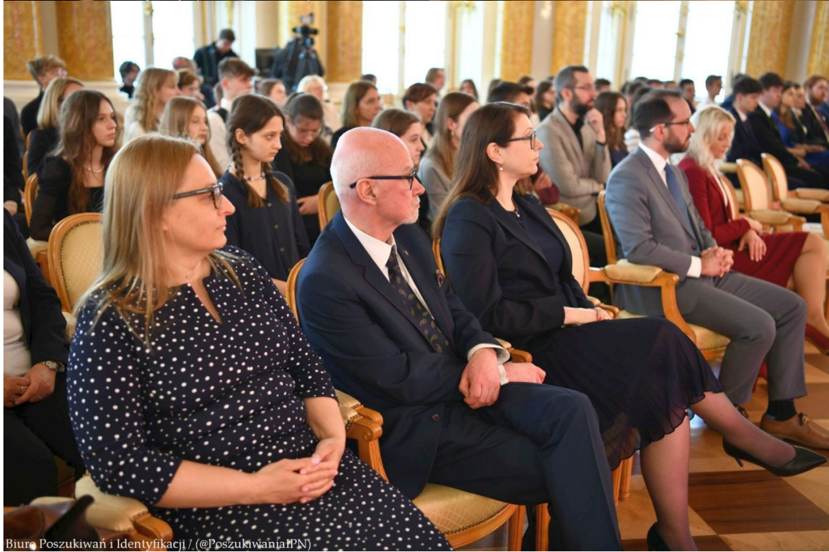
Biuro Poszukiwań i Identyfikacji / (@PoszukiwaniaIPN)