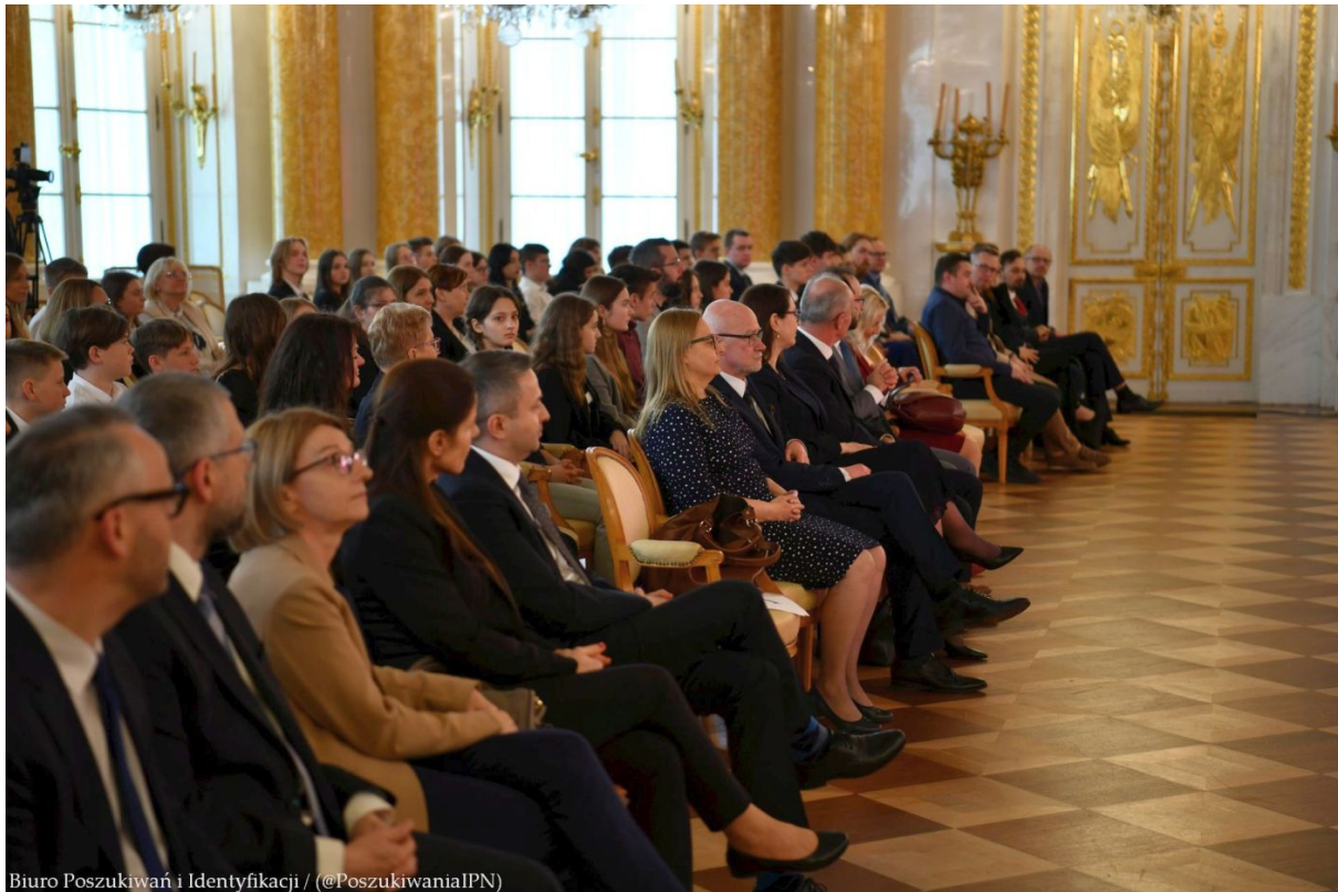
Biuro Poszukiwań i Identyfikacji / (@PoszukiwaniaIPN)