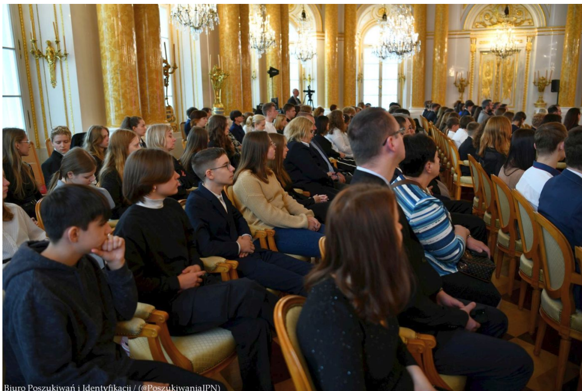
Biuro Poszukiwań i Identyfikacji / (@PoszukiwaniaIPN)

Finał VII edycji projektu edukacyjnego „Łączka i inne miejsca poszukiwań” na Zamku Królewskim w Warszawie – 24 kwietnia 2024. Fot. IPN