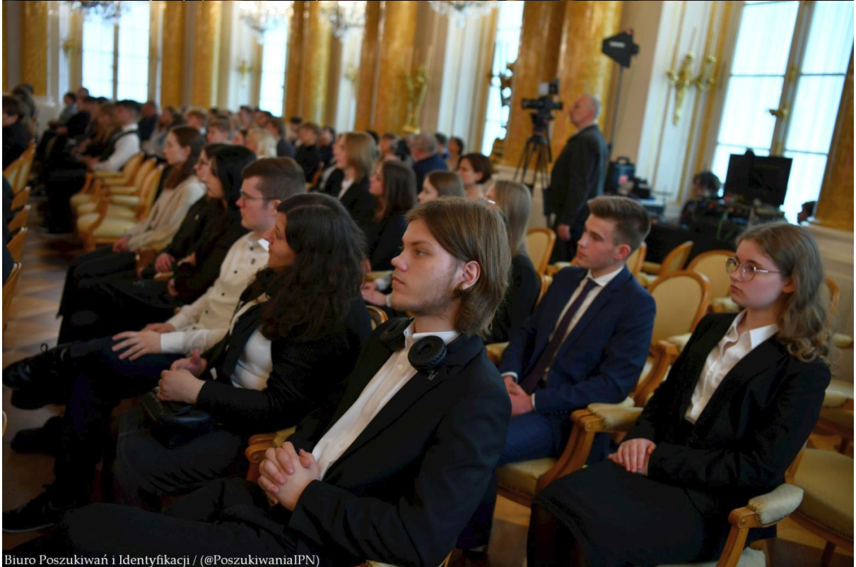
Biuro Poszukiwań i Identyfikacji / (@PoszukiwaniaIPN)