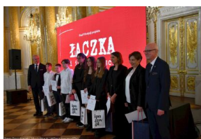
Finał VII edycji projektu edukacyjnego „Łączka i inne miejsca poszukiwań” na Zamku Królewskim w