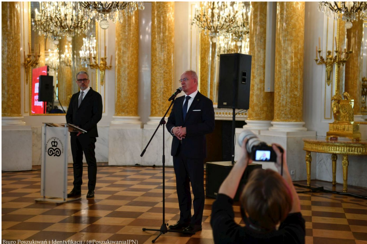
Biuro Poszukiwań i Identyfikacji / (@PoszukiwaniaIPN)

Instytut Pamięci Narodowej zakończył VII edycję projektu edukacyjnego „Łączka i inne miejsca poszukiwań”. Projekt skierowany jest do uczniów szkół podstawowych i ponadpodstawowych, zainteresowanych odkrywaniem nieznanymi miejsc pochówku ofiar reżimów totalitarnych. 24 kwietnia 2024 roku na Zamku Królewskim w Warszawie odbyła się uroczysta gala finałowa projektu.