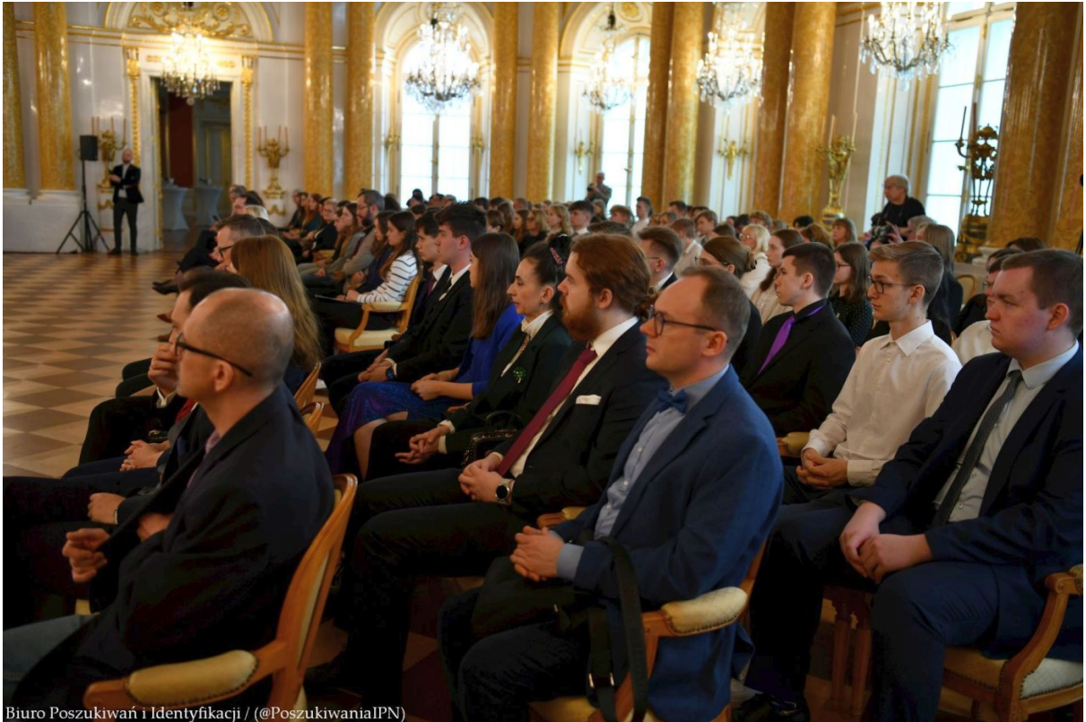
Biuro Poszukiwań i Identyfikacji / (@PoszukiwaniaIPN)