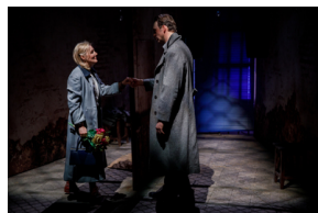
Pokaz spektaklu „Przez ścianę” - Warszawa, 24 kwietnia 2024.