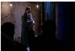
Pokaz spektaklu „Przez ścianę” - Warszawa, 24 kwietnia 2024.