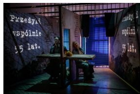
Pokaz spektaklu „Przez ścianę” - Warszawa, 24 kwietnia 2024.