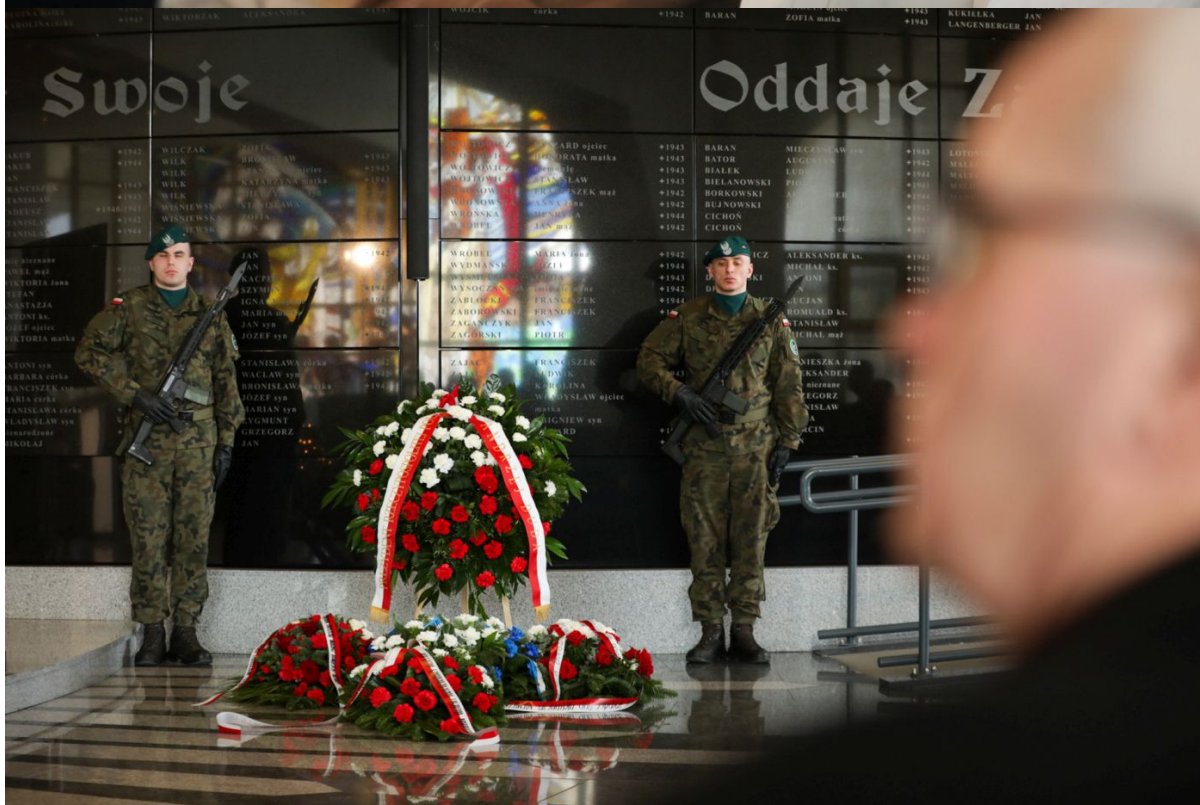
Uroczystości w Toruniu upamiętniające Polaków ratujących Żydów pod okupacją niemiecką – 20 marca 2024.