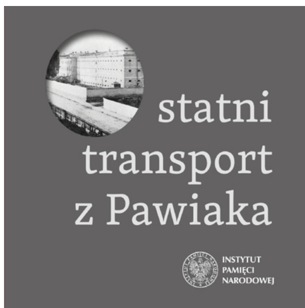
Okładka płyty „Ostatni transport z Pawiaka”