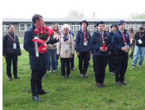
Wyprawa do Niemiec na uroczystości 79. rocznicy oswobodzenia KL Ravensbrück.