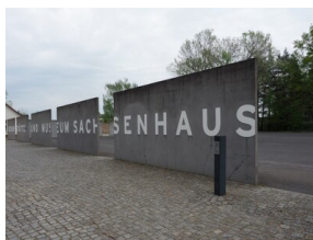
Wyprawa do Niemiec na uroczystości 79. rocznicy oswobodzenia KL Ravensbrück.