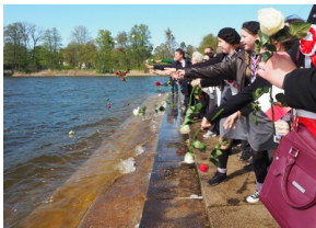
Wyprawa do Niemiec na uroczystości 79. rocznicy oswobodzenia KL Ravensbrück.