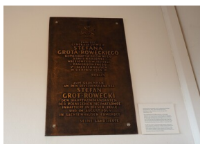
Wyprawa do Niemiec na uroczystości 79. rocznicy oswobodzenia KL Ravensbrück.