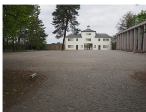
Wyprawa do Niemiec na uroczystości 79. rocznicy oswobodzenia KL Ravensbrück.