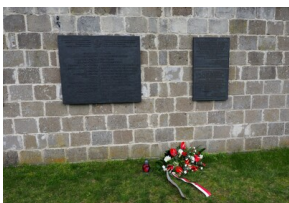
Wyprawa do Niemiec na uroczystości 79. rocznicy oswobodzenia KL Ravensbrück.