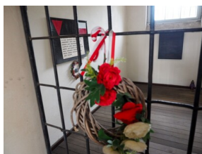
Wyprawa do Niemiec na uroczystości 79. rocznicy oswobodzenia KL Ravensbrück.