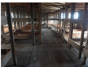
Wyprawa do Niemiec na uroczystości 79. rocznicy oswobodzenia KL Ravensbrück.