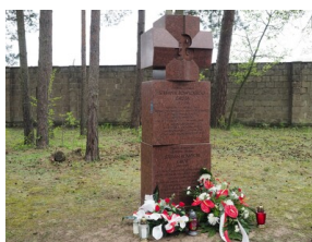
Wyprawa do Niemiec na uroczystości 79. rocznicy oswobodzenia KL Ravensbrück.