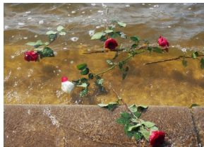
Wyprawa do Niemiec na uroczystości 79. rocznicy oswobodzenia KL Ravensbrück.