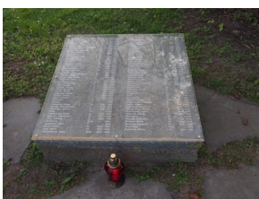
Wyprawa do Niemiec na uroczystości 79. rocznicy oswobodzenia KL Ravensbrück.