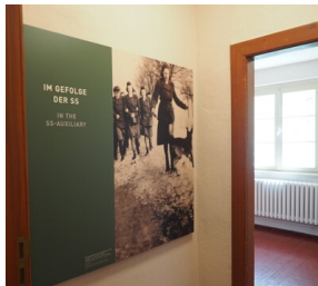
Wyprawa do Niemiec na uroczystości 79. rocznicy oswobodzenia KL Ravensbrück.