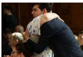
Finał 50. Olimpiady Historycznej – Gdańsk, 14 kwietnia 2024.